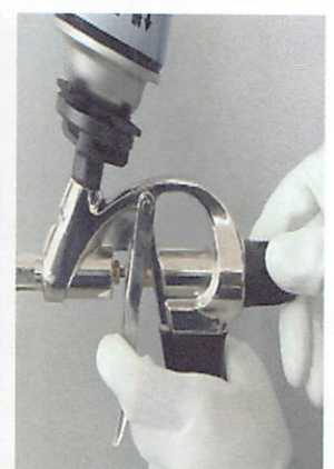
⑤ダイヤルで吐出量を 調整する。