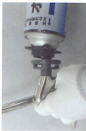
③ガン口金に当てる。