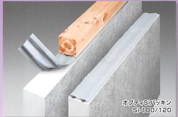
オブティSiパッキン Si-100/120