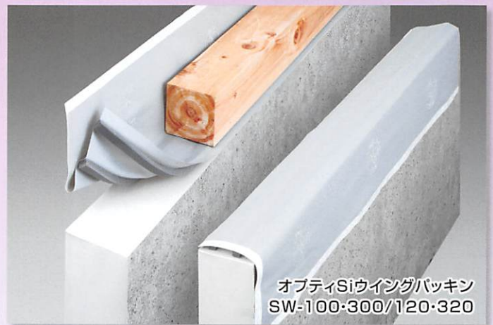
オブティSiウイングパッキン SW-100-300/120-320